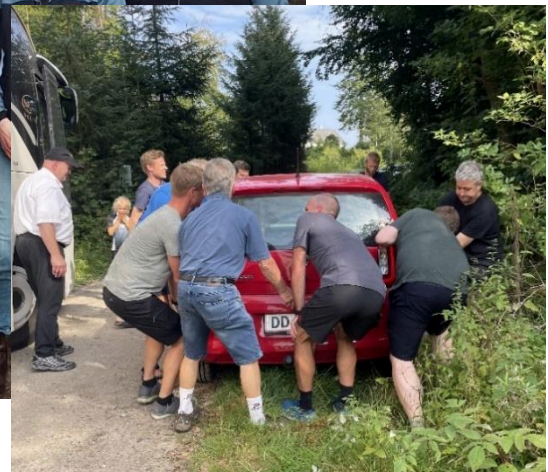
På vej hjem med bus fra divisionsmatchen i Rold holdt en bil i vejen. Den måtte flyttes

10 formænd, fra 80'erne og frem til i dag. Ikke alle er med